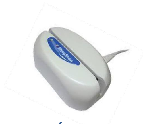
LEITORA DE CÓDIGO DE BARRAS