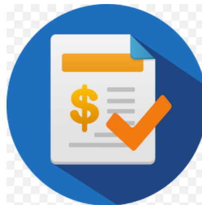
LIMITE OPERACIONAL DIÁRIO