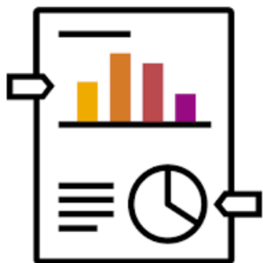
ACOMPANHAMENTO DE PERFORMANCE